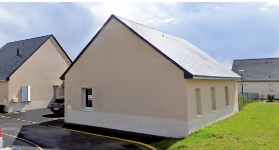
CHINQ-MARS-LA-PILE « Les Mesnils 2 »