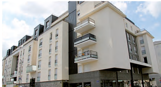
JOUÉ-LÈS-TOURS « Les Halles »

En location-accession avec garage et jardin.