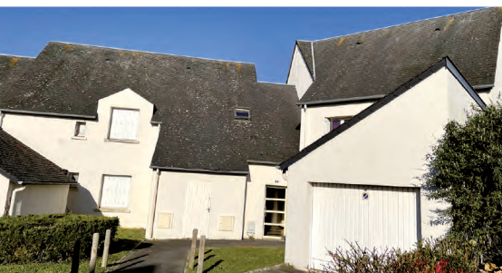
CHINON « La Roche Faucon »