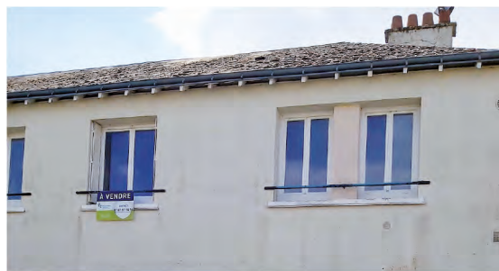
DESCARTES « Peublanc 1 »